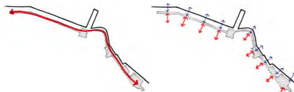
A Orla Conde possibilita o livre caminhar em seus 3km de extensão e reestabelece a integração deste trecho de cidade com a Baía de Guanabara.