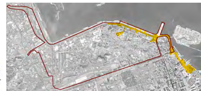
Delimitação da Orla Conde e perímetro da Operação Urbana Consorciada Porto Maravilha.